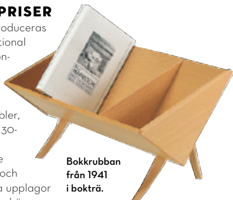
Bokkrubban från 1941 i bokträ.

Särskilt eftertraktade är de äldre Pernillavilfåtöljerna i bra skick, och Eva i original och i mer ovanliga färger. Är möblerna omgjorda sjunker priserna. De mer udda möblerna blir ofta osålda, detta gällde bland annat för en ovanlig Eva på stålårsunderrede på hjul, som bjöds ut på Auktionsverket i Stockholm förra året. Maria, Bruno Mathssons klassiska slagbord, är alltid eftertraktat. Ett sådant bord från 1936 såldes för 25 000 kronor på Auktionsverket förra året, och en vilstol från 30-talet inbringade 16 000 kr. När Bruno Mathssons sommarhus i halländska Frösakull bjöds ut i en specialauktion av Auktionsverket i höstas väcktes ett stort intresse, och många lockades att komma till visningen. Ingen köpte dock huset som hade ett utropspris på 3-4 miljoner (se bild på förra sidan).