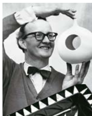
STIG LINDBERG – industridesigner, keramiker och illustratör – hans lekfulla former och figurer hör till det bästa från decennierna kring H55. www.stiglindberg.se