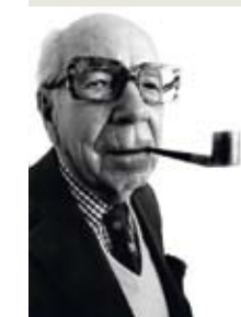
SIGVARD BERNADOTTE – Margrethe-skålen, mönstret Virrvarr och konservöppnaren Röda Klara – designprinsen är pappa till några av Sveriges mest använda och igenkända bruksföremål. www.skonahem.com