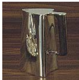
Isvattenkanna i silver för Georg Jensen, 1952, udda, elegant och alltid Sigvard Bernadottes egen favorit.