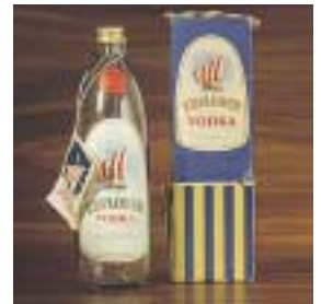
Rymd- och raketinspirerad glasflaska Explorer Vodka, 1957, avsedd för export till USA, med originalförpackning. (Etiketten utförd av Torsten Eriksson).