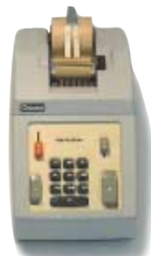
Additionsmaskinen för Odnher, 1960, en storsäljare i lättmetall och plast.