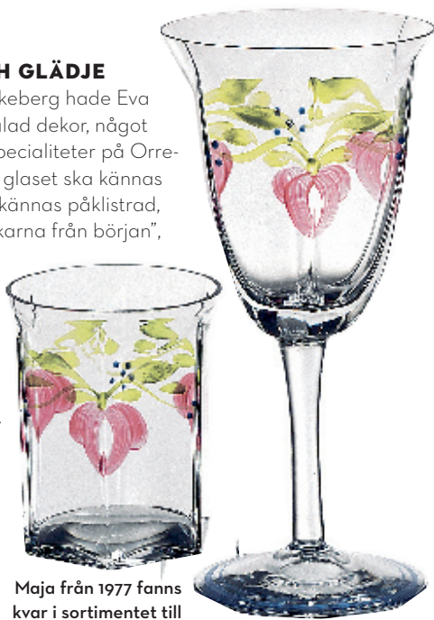
Maja från 1977 fanns kvar i sortimentet till 2003, och vissa delar finns kvar till 2008.