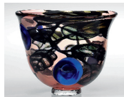
Skål Prune i graalteknik med dekor av plommon i blått mot ljusrött underfång med överfång i grönt, från Orrefors 1990. Sålld på Bukowskis förra våren för 7 000 kr.