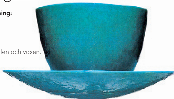
Malakit gjordes för Pukeberg i början av 90-talet. Skålen och fatet - samt syskonet Indigo - tillverkades senare av Målerås i ytterligare några år.