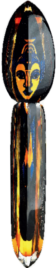
Djupfryst prinsessa, skulptur från 1992 för Muraya i graal-teknik. Höjd 59 cm. Sålades på Stockholms auktionsverk 2005 för 21 000 kr.