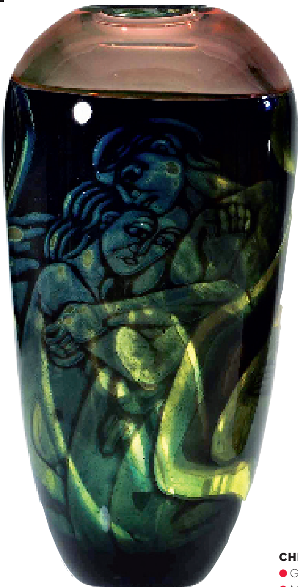
Vasen Famntag gjordes i 30 exemplar för Orrefors 1990. Sålld på Bukowskis moderna våren 2006 för 40 000 kr.