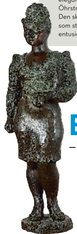
Vårflickan är ett av Öhrströms mest kända verk. Skulpturen blev mycket omtalad tack vare dess vardagliga uppsyn.