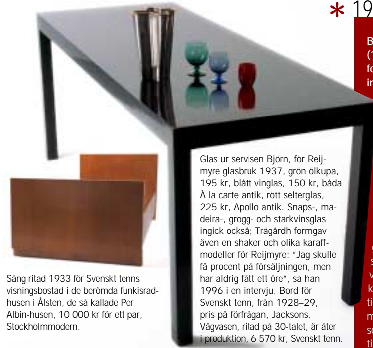
Säng ritad 1933 för Svenskt tenns visningsbostad i de berömda funkisradhusen i Ålsten, de så kallade Per Albin-husen, 10 000 kr för ett par, Stockholmodern.