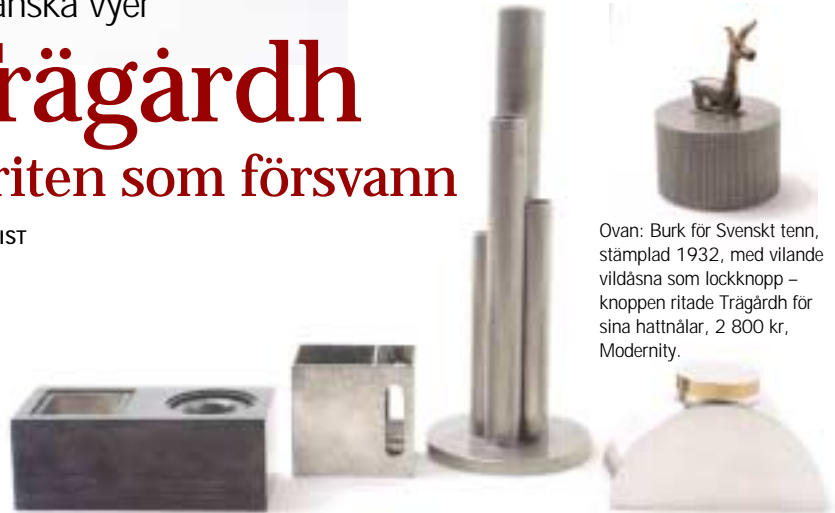
Ovan: Burk för Svenskt tenn, stämplad 1932, med vilande vildåsna som lockknopp – knoppen ritade Trägårdh för sina hattnålar, 2 800 kr, Modernity.