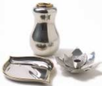
Mjuk linje. Lövfatet, 1 175 kr, och päronvasen, 2 500 kr, båda Svenskt tenn, är formgivna på 30-talet; ljusstaken, också ritad på 30-talet, tillhör Svenskt tenns samlingar.