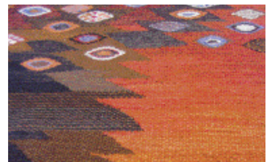
Tånga, 50-årsjubilerande gobelängmatta som visades på restaurang Parapeten vid Helsingborgsutställningen H 55.