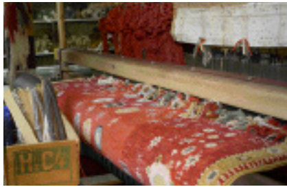
Handarbete på hög nivå. Här mattorna Röda rabatten och Krusbär i vävstolarna.

Mattorna vävs helt för hand i yppersta kvalitet, och det är fortfarande samma instruktioner som Märta Måås-Fjetterström gav sina väverskor som används i dag - ett arv från väverska till väverska i över 80 år. Förutom de över 700 mönstren av Märta Måås-Fjetterström - till mattor och vävnader i olika tekniker som flossa, rya och rölakan - för-