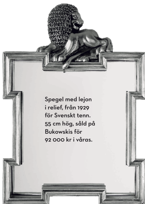
Spiegel med lejon i relief, från 1929 för Svenskt tenn. 55 cm hög, såld på Bukowskis för 92 000 kr i våras.