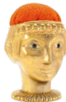
T v: nåldyna av förgyllt tenn, för Svenskt tenn.