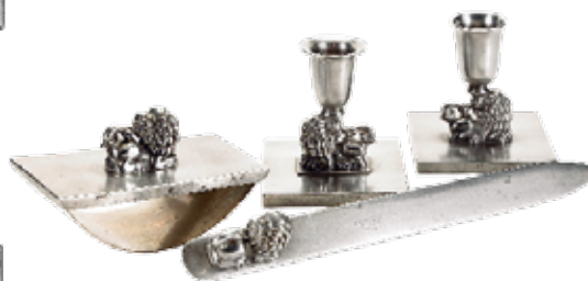
Skrivbordsatts av tenn i fyra delar: ljusstakar, läskpress, brevkniv.