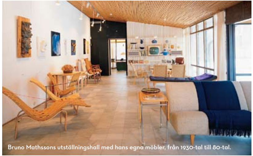
Bruno Mathssons utställningshall med hans egna möbler, från 1930-tal till 80-tal.