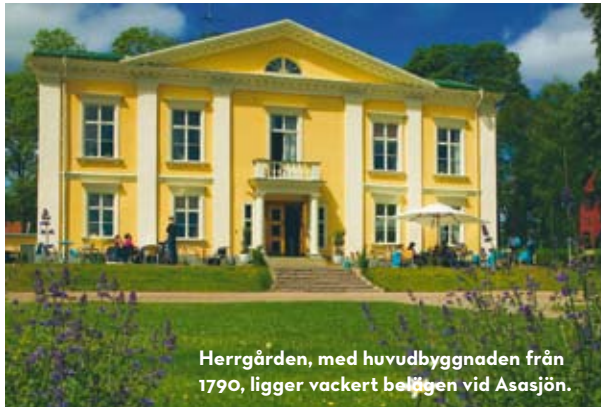
Herrgården, med huvudbyggnaden från 1790, ligger vackert belägen vid Asasjön.