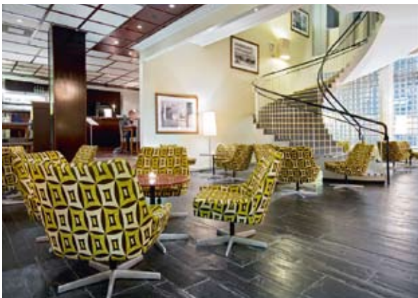
Ovan: Nya Kiasma av Vesa Honkonen, ritad för konstmuseet med samma namn i Helsingfors och i produktion hos Källemo.

KOMMERSEN är inte lika het som i Glasriket några mil söderut, men många av möbelföretagen i Småland har fina små utställningar att besöka. För den som vill gå till rötterna i svensk modern möbelhistoria finns närmast okända arkiv och utställningar att söka upp. Hos Gemla i den stiliga funkisfabriken i Diö eller hos de saligt avsmnade storheterna: Nässjö stolfabrik och Svenska möbelfabrikerna i Bodafors. Här gäller det att slå en signal och göra upp tid. Observera att de flesta tillverkare inte driver butik. Du kan alltså inte fynda på plats, men väl provsitta och se miljöerna där möblerna växer fram.