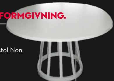
La Chapelle i mått 146 x 140 cm passar som matbord.