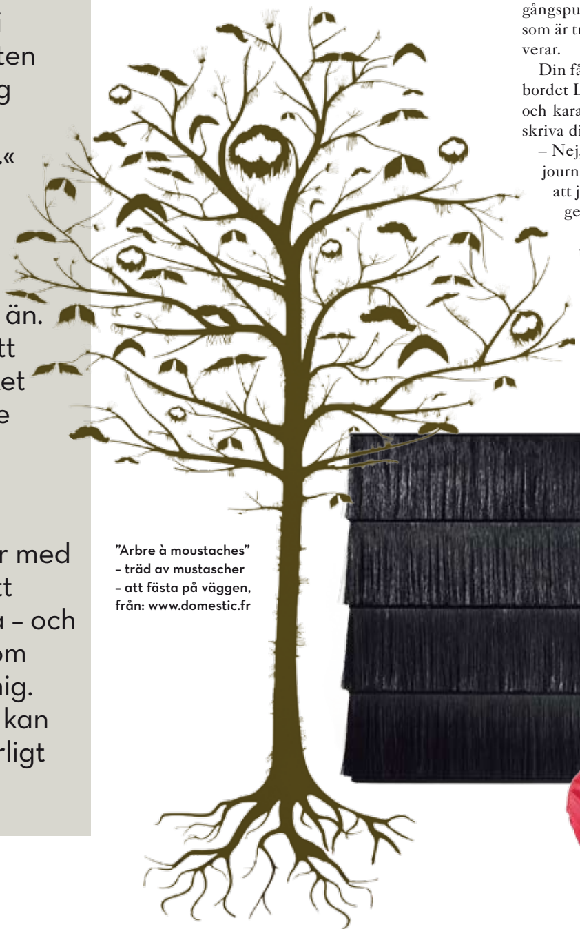
"Arbre à moustaches" – träd av mustascher – att fästa på väggen, från: www.domestic.fr